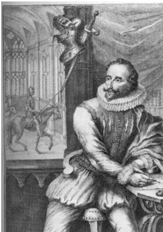
RETRATO DE CERVANTES DE SAAVEDRA POR EL MISMO.