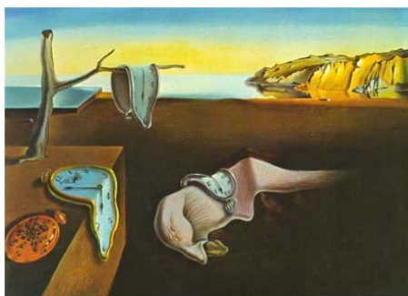
La persistencia de la memoria Salvador Dalí