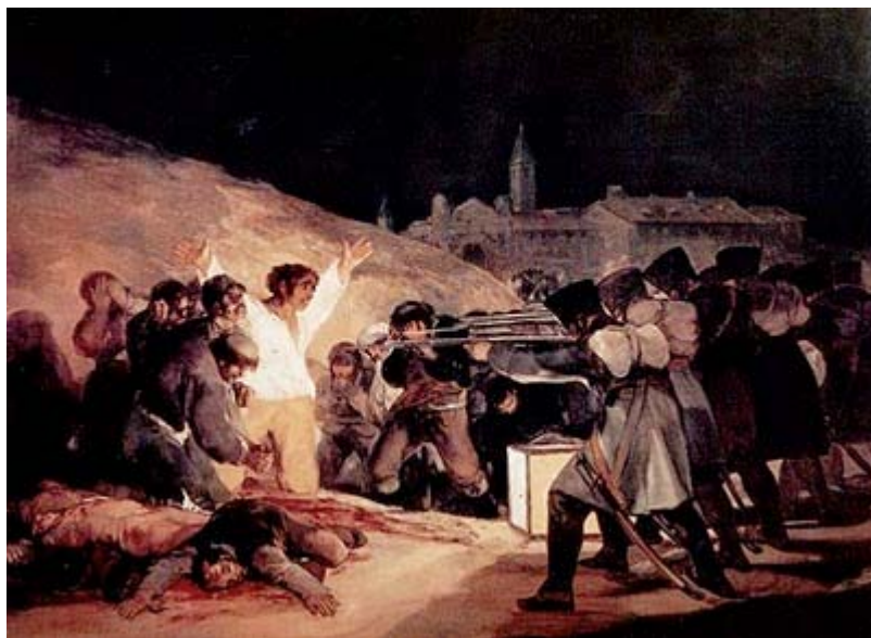
El tres de mayo de 1808 (1814) Francisco Goya y Lucientes

b) ¿Qué palabras del primer ejercicio podrían aparecer en una descripción de este cuadro? Explica tus elecciones.