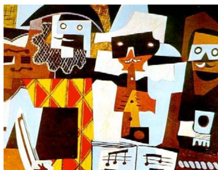
Los músicos Pablo Picasso