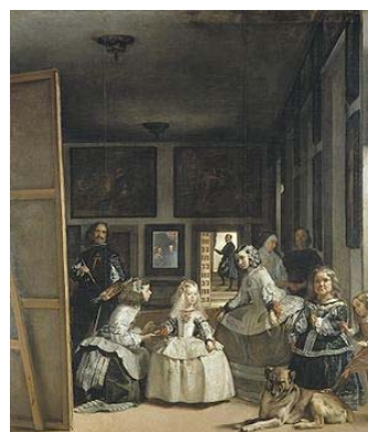
Las Meninas Diego Velázquez