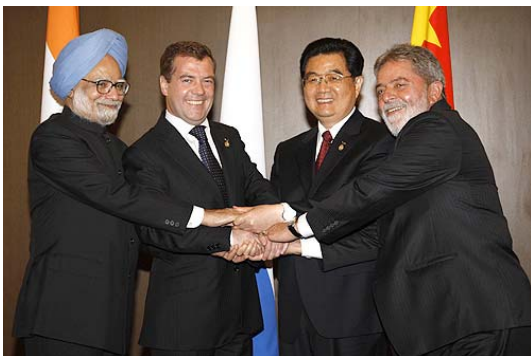
Los cuatro países BRIC: Brasil, Rusia, India y China.